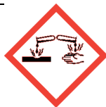
Piktogram GHS 05: