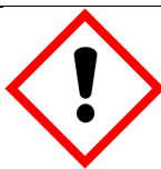
Piktogram GHS 07: